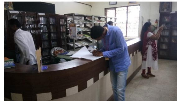
A Student giving Feedback