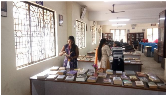
Student seeing books