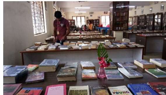
Student Observing Books